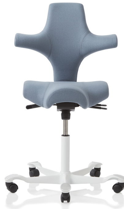
Design: Peter Opsvik. Modèle déposé et breveté