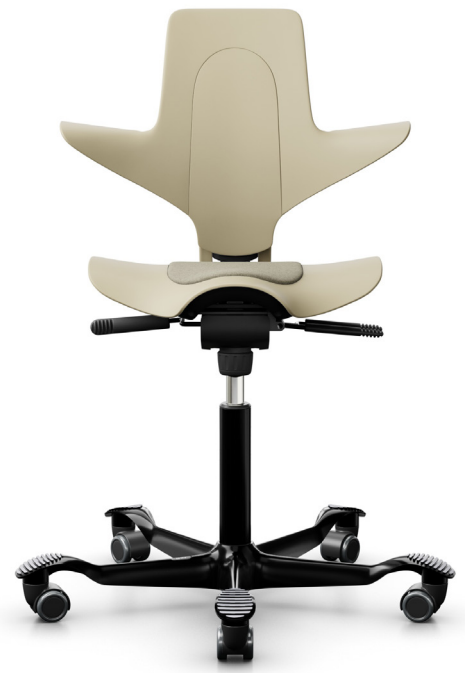
Design: Peter Opsvik. Modèle déposé et breveté