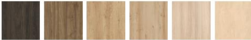
Roble oscuro Nogal Nebraska Haya Natural Roble Claro Arce