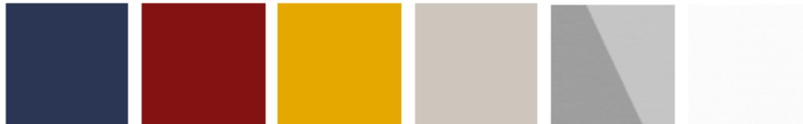
Azul Burdeos Ocre Cachemir Aluminio Blanco