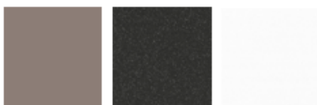
Basalto Zenit Antracita Metal Blanco