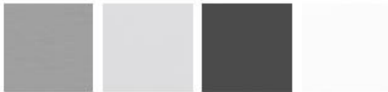
Aluminio Gris Gris sombra Blanco

Pieds en métal massif thermolaqué. Plateau en mélaminé et DM Laqué brillant et mat