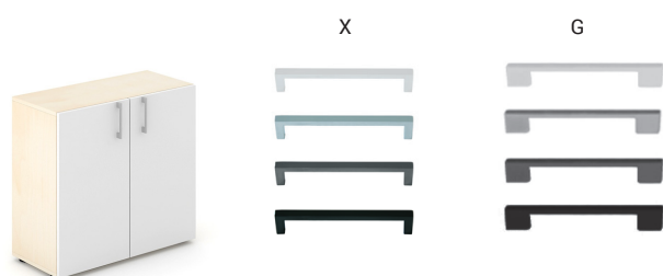
Type de poignées